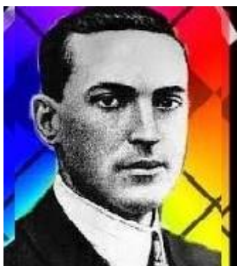
LEV VIGOTSKY 1896-1934