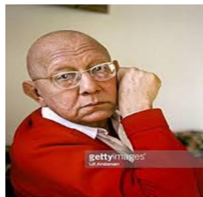
CORNÉLIO CASTORADIS 1922-1997